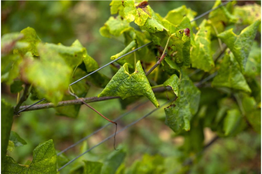
Symptômes de Flavescence