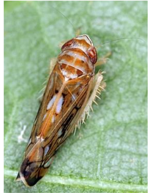
Adulte de Scaphoideus titanus

Il n'y a pas de transmission intergénérationnelle ; en début de cycle, tous les œufs sont sains.