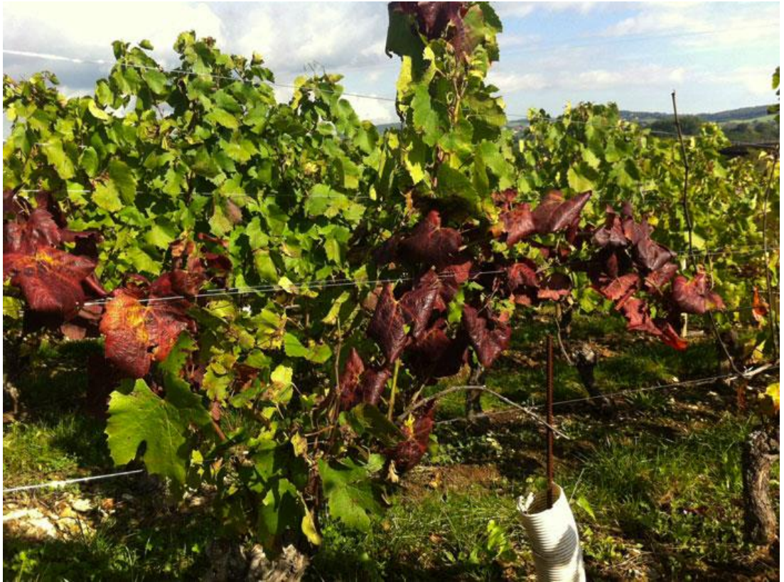
Symptômes de Flavescence