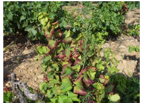
Symptômes sur cépage rouge