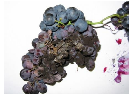
Symptôme d'OTA sur grenache noir

Evaluation du risque : surveiller l'apparition de symptômes sur grappes.