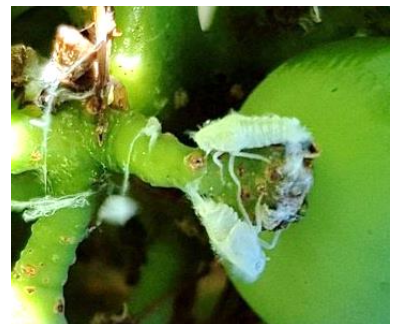
Larves de Metcalfa pruinosa

Evaluation du risque : le risque est très faible. Leur présence, si elle reste limitée, n'est pas directement nuisible pour la vigne.