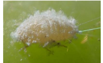
Cochenille Lécanine (à en haut) et Cochenille farineuse (en bas)