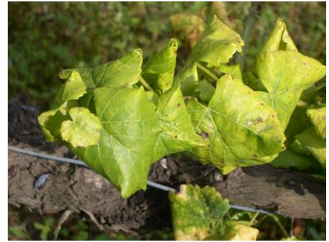
Symptômes sur cépage blanc

Pour toutes les d'informations, consulter le site de la DRAAF Occitanie .