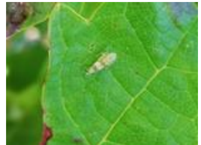
Larve cicadelle L4 vectrice de la flavescence dorée

Méthodes prophylactiques : L'épamprage permet de détruire un support de larves et de diminuer les populations de cicadelles vectrices.