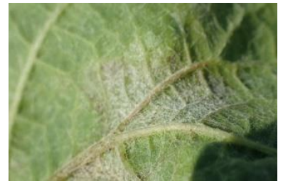
Symptômes d'oïdium sur baie et sur feuille