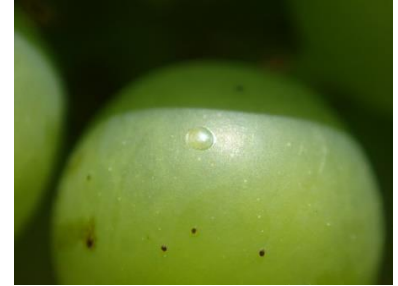
Eudémis : ponte fraîche

Dans le secteur de la Plaine (Nord et Sud Tech) les dépôts de pontes sont encore observés.