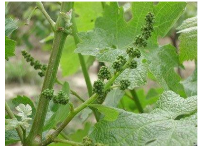
Stade « boutons floraux séparés » (stade 17 ou H ou BBCH 57)

Les stades majoritairement observés vont de « boutons floraux séparés » (stade 17 ou H ou BBCH 57) à « tout début de la floraison, chute des capuchons floraux » (stade 19 ou BBCH 61).