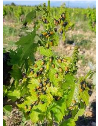
Nombreux Malacosomes du Portugal

Évaluation du risque : le risque est faible.