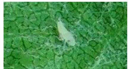
Larve (L1) de Scaphoideus titanus