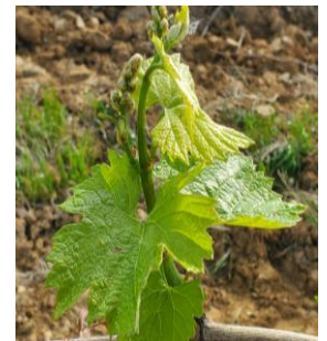
5 ou 6 feuilles étalées, inflorescences visibles (stade 12 ou F ou BBCH 14-53)

Les stades majoritairement observés vont de « 5 ou 6 feuilles étalées, inflorescences visibles » (stade F ou BBCH 14-53) à « boutons floraux encore agglomérés » (stade G ou BBCH 55).