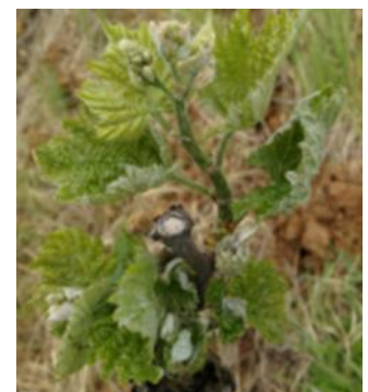
Symptômes d'oidium : drapeau sur Carignan