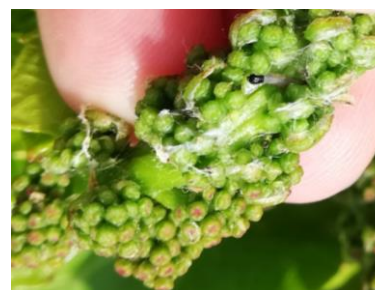
Larve de pyrale et dégâts

Les larves sont visibles sur le secteur de la Plaine Nord Tech (communes Salses, Saint Hippolyte, Espira de l'Agly...). Les dégâts sont visibles sur feuilles et inflorescences.