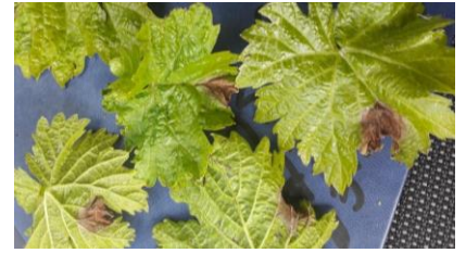
Dégâts de pourriture grise sur Portan

Quelques symptômes sur feuilles sont visibles au vignoble. Leur fréquence reste très faible.