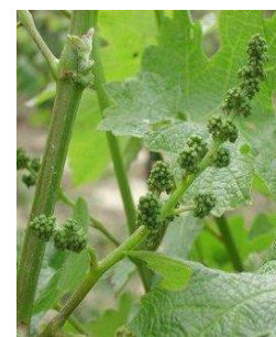
Boutons floraux encore agglomérés (stade 15 ou G ou BBCH 55)