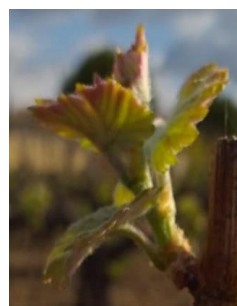
2 ou 3 feuilles étalées (stade 09 ou E ou BBCH 12-13)

Les stades majoritairement observés sont « 2-3 feuilles étalées » (stade 09 ou E ou BBCH 12 ou 13) à « bouton floraux encore agglomérés » (stade 15 ou G ou BBCH 55).