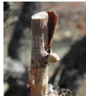
Bourgeon dans le coton (stade 03 ou B ou BBCH 05)

Dans quelques très rares situations (Chardonnay, Muscat à petits grains), certaines parcelles très précoces et taillées tôt atteignent le stade « boutons floraux encore agglomérés » (stade 15 ou G ou BBCH 55).