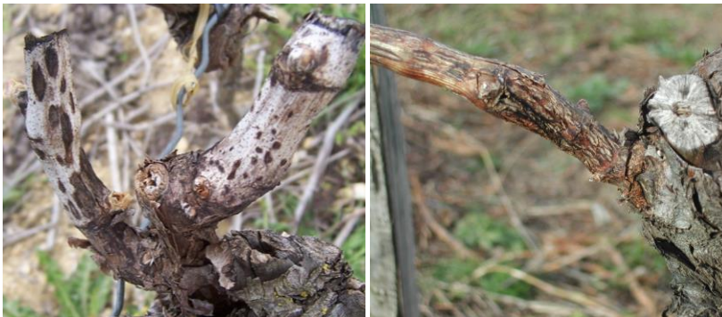
Excoriose : Symptômes sur bois et rameaux – à gauche : pycnides - à droite : excoriation sévère

Quelques symptômes sont observés sur les parcelles de suivis avec des intensités d'attaque faibles. Mais, localement, des symptômes plus importants sont visibles. La maladie semble notamment en recrudescence sur Grenache.