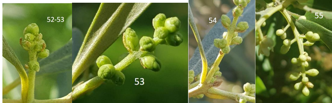
Stades phénologiques.