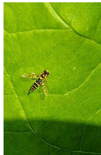
Syrphe sur feuille de tabac

Les syrphes sont présents sur 3 ha pour le secteur de Sanvensa (12) et sur 5 ha pour le secteur de Beauville (47). Ils sont présents sur 15 ha dans la zone de Thuret (63) et sur 10 ha pour celle de Beaurepaire (38). On les note sur 50 ha pour le secteur de Chémillé (49) et 60 ha pour Vivonne (86) où ils régulent leurs proies. Les apparitions de chrysopes et hémérobès s'observent sur 20 ha sur les secteurs de Vivonne (86), Chemillé (49) et sur 1 ha pour Sanvensa (12).