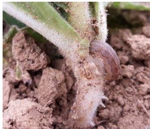
Vers gris sur plant de tabac

Sur la parcelle de référence d'Amuré (79), on observe les traces de quelques corbeaux ou corneilles. En parcelle de tour de plaine, sur le secteur de Thuret (63), on observe des traces de corbeaux sur 3 ha et sur 8 ha pour le secteur de Chemillé (49). On note également la présence de ceux-ci sur le secteur de Vivonne (86) sur une surface de 36 ha.