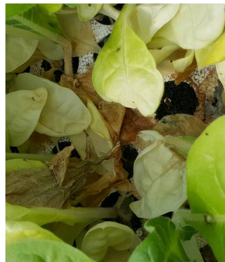
Dégâts de botrytis sur plant de tabac

En tour de plaine, sa présence est signalée sur 1 ha pour les zones de Thuret (63) et Sanvensa (12). Il est constant sur 11 ha pour le secteur de Chemillé (49). Pour Beaurepaire (38), on l'observe sur 15 ha avec une fréquence d'attaque de moins de 20 %. Sur 25 ha, 15 ha présentent des dégâts de moins de 20 % pour la zone de Vivonne (86). Pour le secteur de Hochfelden (67) on observe des dégâts de plus de 20 % sur 51 ha et une fréquence d'attaque de moins de 20 % sur 28 ha.