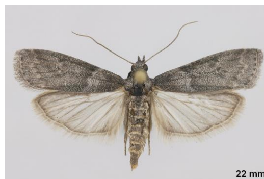
Ectomyelois ceratoniae

Vous pouvez accéder à davantage de photos en consultant ce lien : http://lepiforum.org/wiki/page/Apomyelois_Ceratoniae .