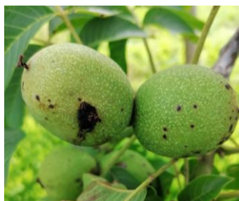
A gauche, dégât de larve de carpocapse

Des dégâts sur fruits sont observés dans les parcelles.