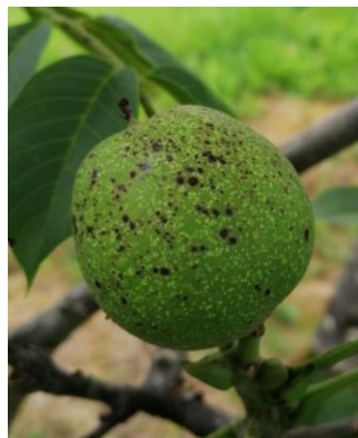
Symptômes d'antracnose sur feuille et sur fruit