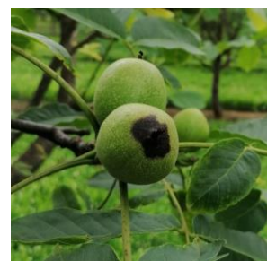
Symptôme de bactériose

Des taches de bactériose ont été observées sur des feuilles et des fruits dans plusieurs vergers.