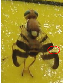
Rhagoletis completa

Sur le réseau de piégeages mis en place dans les secteurs de production, les 1 ères captures de mouches du brou ont été signalées à partir du 03/07 à Sainte Foy La Grande (33).