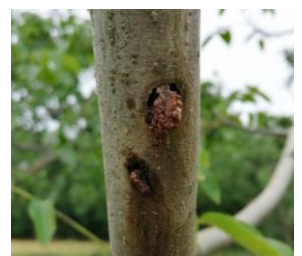
Dégâts de larves de zeuzère

Les orifices de pénétration des larves sont marqués par de petits tas de sciure et d'excréments (en forme de petits cylindres) accompagnés d'écoulement de sève, particulièrement visibles sur les branches (voir photo ci-contre).