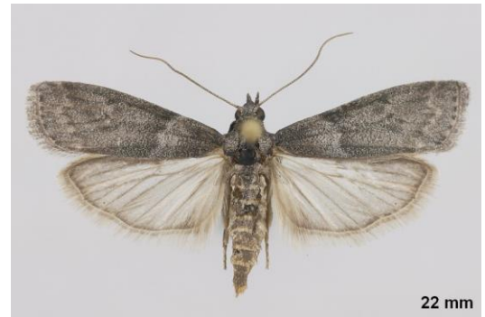
Ectomyelois ceratoniae

Vous pouvez accéder à davantage de photos en consultant ce lien : http://lepiforum.org/wiki/page/Apomyelois_Ceratoniae .