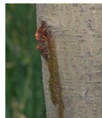
Dégât de larves de zeuzère

Les orifices de pénétration des larves sont marqués par de petits tas de sciure et d'excréments (en forme de petits cylindres) accompagnés d'écoulement de sève, particulièrement visibles sur les grosses branches (voir photo ci-contre).