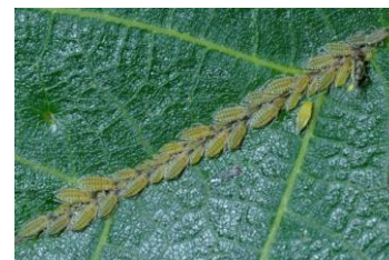
Callaphis juglandis

Des populations importantes peuvent donc entraîner la diminution du calibre des noix et/ou nuire à la qualité du cerneau.