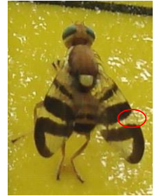
Rhagoletis completa

Rhagoletis completa , petite mouche d'environ 6 mm originaire de l'Amérique du Nord, n'a qu'une génération par an. Le vol, d'une semaine environ, s'étale de fin juin à début septembre. La femelle pond, 4 à 7 jours après l'accouplement, 300 à 400 œufs à raison d'une quinzaine par fruit. Un marquage olfactif du fruit ayant déjà reçu des pontes explique que chaque mouche est capable de contaminer plus d'une vingtaine de fruits. L'incubation des œufs prend 5 à 10 jours et le développement larvaire se poursuit durant 3 à 5 semaines dans le brou de la noix. Les larves tombent ensuite au sol et s'enfouissent de quelques centimètres pour y hiverner sous forme de pupes.