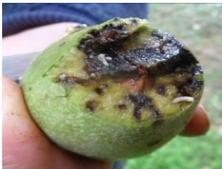
Dégâts de mouche du brou

Les dégâts sont dus au développement des larves dans la partie charnue du fruit (le brou de la noix), la rendant molle, humide et noire. Les premiers signes d'infestation sont de petites taches noires sur le brou créées par la cicatrice de ponte. Ces taches peuvent être confondues avec celles de la bactériose, mais en regardant de plus près, le brou est noirci et non visqueux.