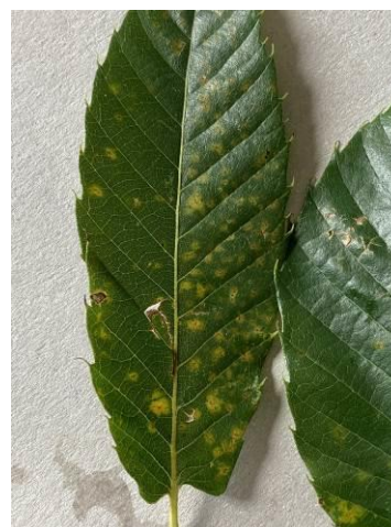
Dégât de septoriose sur feuille 30/09/2021