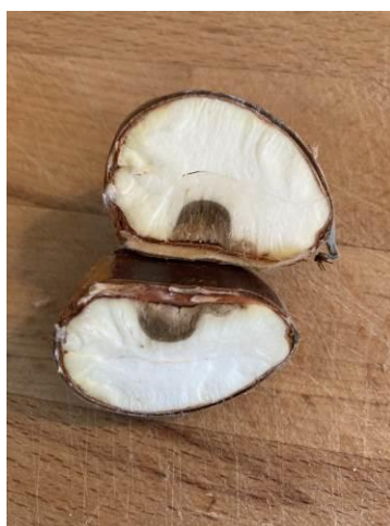
Début de pourriture marron 27/09/2021