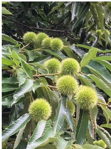
Bouche de Bétizac