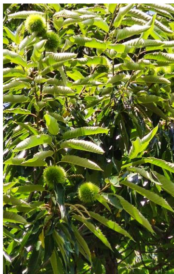
Bogues de Bouche de Bétizac Dordogne – 26/07/2021