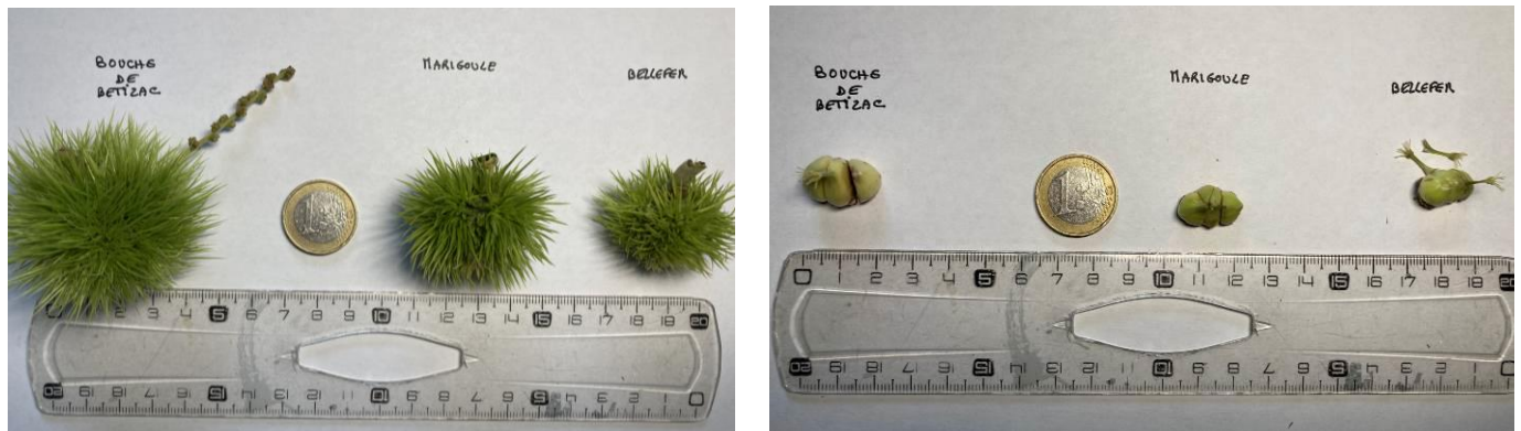
Bogues prélevées le 27/07/2021 en Corrèze

Grossissement des bogues et des châtaignes. Les amandes fécondées dans les châtaignes ne sont pas encore distinguables.