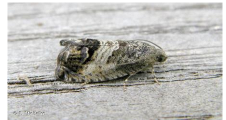
Papillon adulte (Imago) de carpocapse de la châtaigne ( Cydia splendana )

Le vol a commencé il y a deux semaines dans les secteurs les plus précoces.