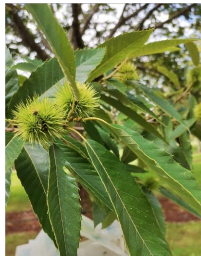
Bogue de Marigoule Dordogne – 26/07/2021