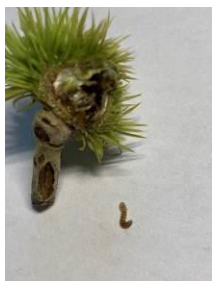
Jeune bogue infestée chutée au sol début août.