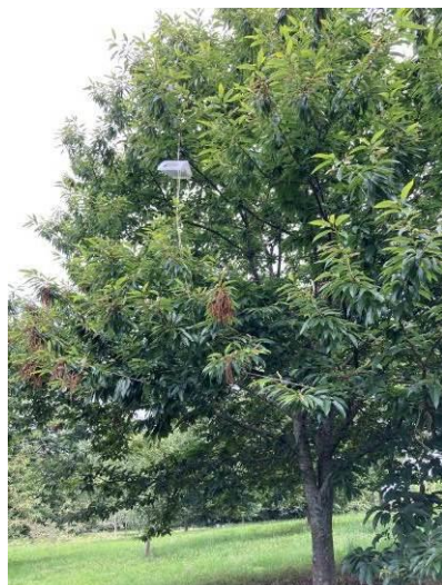
Piège à phéromone posé au plus près des fruits