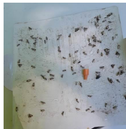
Plaque engluée Producteur à Coussac Bonneval 4 juillet 2022

(Crédits photos : M. LEON-CHAPOUX (CHLORIS ARBO), Thierry CHIBOIS (producteur))