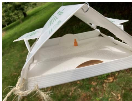
Phéromone attirant les papillons mâles de la tordeuse de la châtaigne, piégés sur une plaque engluée