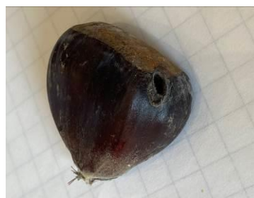
Trou de sortie de la larve de tordeuse à la récolte (Plus gros que celui du carpocapse)