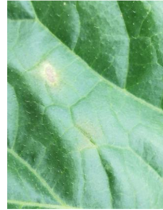
Symptômes de mildiou

Évaluation du risque : Avec la climatologie actuelle, surtout si les humectations du feuillage sont importantes, le risque est moyen à fort en fonction des parcelles.