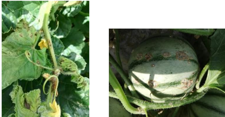
Symptômes de cladosporiose sur feuilles, tige et fruit

Des symptômes de cladosporiose sont toujours observés avec des dégâts sur feuilles, tiges et fruits.