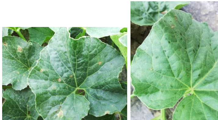
Symptômes de bactériose su feuilles

Les symptômes de bactériose sont toujours présents avec de nouvelles contaminations en début de semaine 31.