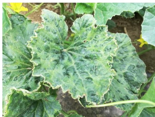
Symptômes de viroses sur feuilles

Des symptômes de viroses sont observés sur le réseau et ils semblent se développer.