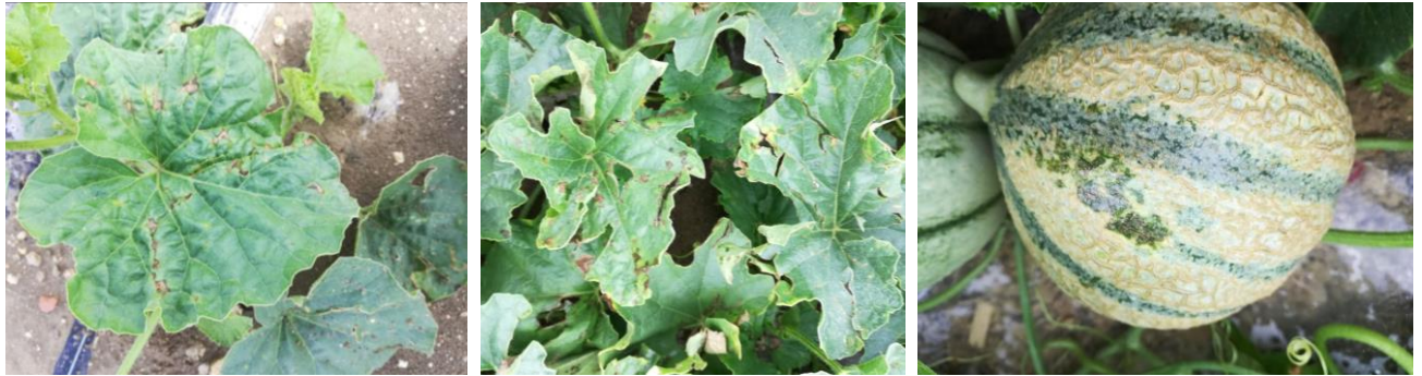
Dégâts de bactériose su feuilles et fruit

Après des pluviométries et des baisses de températures, les taches se réactivent même si les températures nocturnes ne sont pas en-dessous de 13°C (température mini de l'indice de risque). Pour la bactériose , il existe un Outil d'Aide à la Décision (OAD) : l'indice de risque bactériose. Il