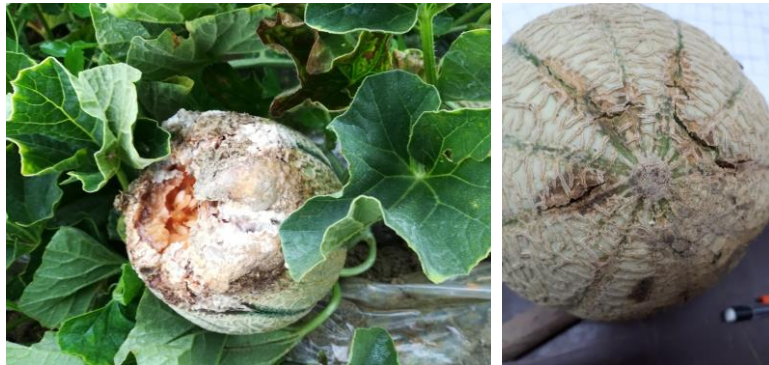
A gauche : Symptômes de pourriture sur fruit

Des pourritures de fruits sont observées, au niveau de l'attache pistillaire et pédonculaire : sclérotinia, didymella et autre pourriture.