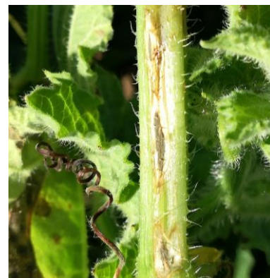
Symptômes de cladosporiose sur tige

Avec la climatologie particulièrement dégradée du début d'été, les symptômes de bactériose sont présents sur de nombreuses parcelles, avec des dégâts sur tous les organes de la plante : feuille, tige et fruits.