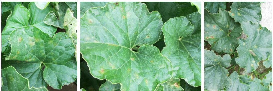
Symptômes de mildiou

De nouveaux symptômes sont apparus sur des variétés et des stades sensibles dans les parcelles de plein champ.