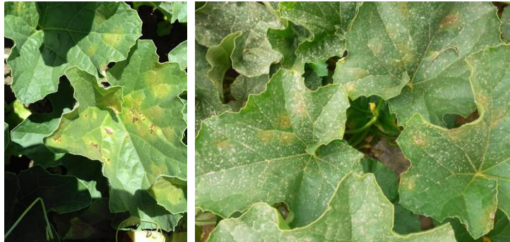
Nouvelles sorties de taches de mildiou sur feuilles (semaine 28)