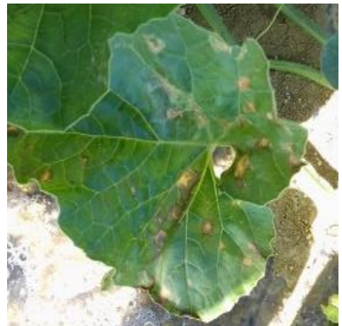
En haut : Cladosporiose – En bas : Bactériose sur feuilles