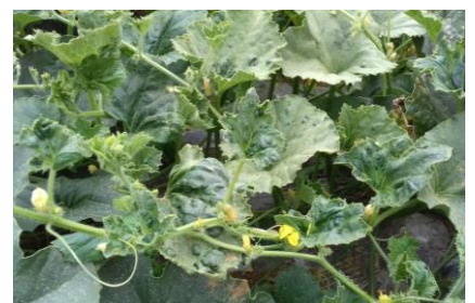
Symptômes de virose - Photo CA82

Des symptômes de viroses sont souvent observés en parcelles de production (contamination via les pucerons ailés venant d'autres parcelles de melon ou d'autres cultures).