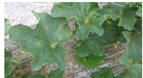
Symptômes de mildiou sur feuilles

Dans le Sud Ouest, c'est le bio-agresseur le plus présent et ce depuis 2012.