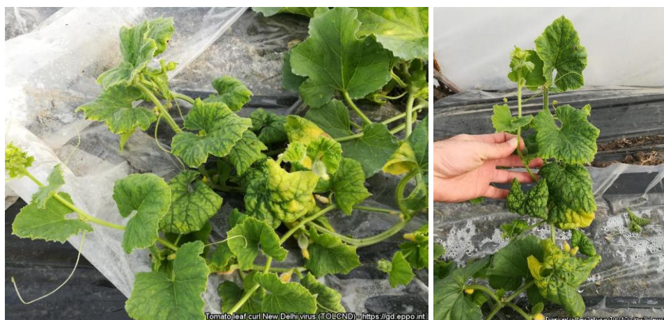
Symptômes du ToLCNDV sur plante