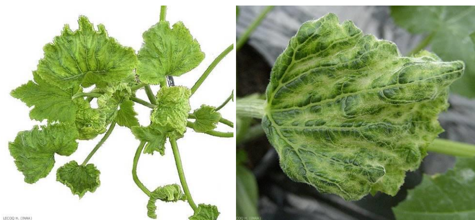
Symptômes du ToLCNDV sur feuilles de courgettes