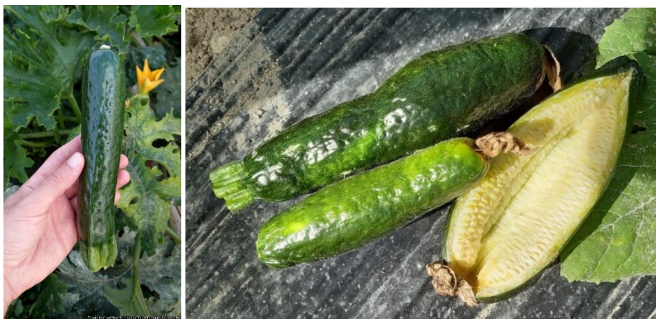
Symptômes du ToLCNDV sur fruit

D'autres photos et informations disponibles sur Ephytia ICI