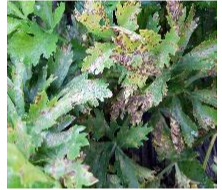
Septoriose sur Céleri (plantation du 06/08)