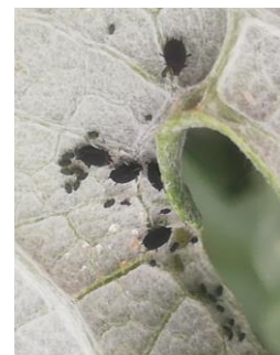
Puceron noir ( Aphis fabae ) sur Artichaut Photo CA 66