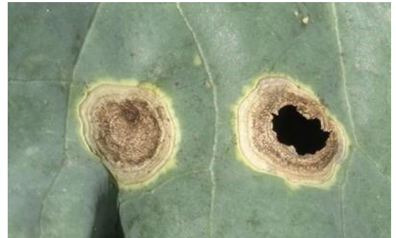
Alternaria sur chou - Photo CA30