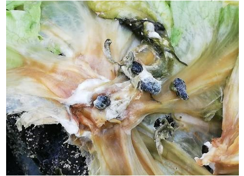
Scléroties de Sclerotinia sclerotiorum sur laitue