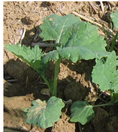
Stade 3-4 feuilles du colza

Déterminer la bonne période de semis : Lien article Terres Inovia