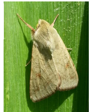
Papillon d'H. armigera - Ph Papillon d'H. armigera - Photo FREDON Aquitaine

Le vol semble montré un second pic depuis le début du suivi dans les parcelles de pois chiche. Les conditions sont propices avec le retour de températures estivales et l'ensemble des parcelles sont actuellement dans la période de risque. L'avancée de la maturité des plantes signalera la sortie de la phase à risque.