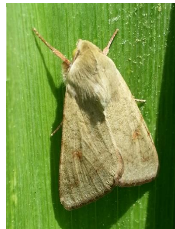
Papillon d'H. armigera - Ph Papillon d'H. armigera