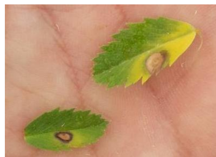
Symptômes d'ascochyte sur feuilles

Surveillez vos parcelles, en observant feuilles et tiges.