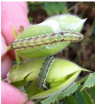
Chenilles d'H. armigera dans gousses de pois chiche

Le suivi de ce ravageur est réalisé avec des pièges en végétation qui permettent de détecter la présence de papillons et suivre les vols. Pour 2020, 34 pièges sont déployés sur le territoire.