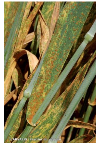
Figure 1 : Pustule de rouille brune

Pustules allant du brun au brun orangé, dispersées sur la feuille, essentiellement sur la face supérieure. Les quelques pustules du début d'attaque peuvent générer des centaines de pustules, si le climat est chaud et humide.