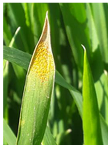
Pustules de rouille jaune sur blé dur (Camargue).

Les symptômes de rouille jaune apparaissent d'abord par foyer.