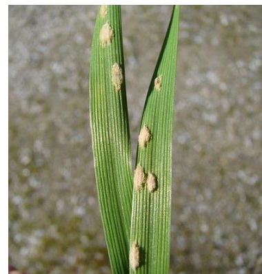
Pustules d'oïdium.

Un feutrage blanc se développe sur la surface des feuilles. Le feutrage devient par la suite grisâtre et est parsemé de petits points noirs. Le champignon peut gagner les tiges, les épis et les barbes des céréales. Généralement les symptômes restent cantonnés aux parties basses des plantes. Le champignon se développe à la surface des feuilles et peut donc être lessivé par de fortes pluies.