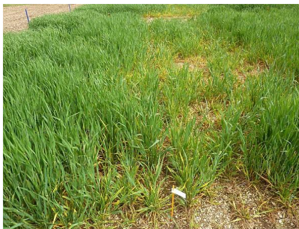
Parcelles touchées par de la JNO. - Photo Arvalis

Seuil indicatif de risque : 10 % de plantes portant au moins un puceron, ou présence de pucerons plus de 10 jours dans la parcelle.