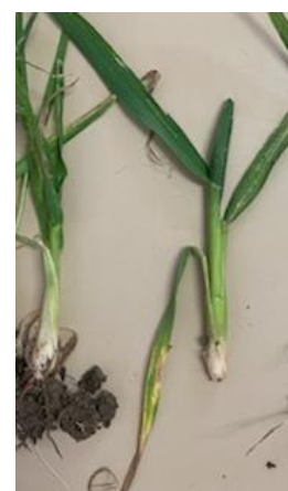
Dégâts de mouche ; pied en poireau et dernière feuille courte

Plante : La dernière feuille reste verte mais est beaucoup plus courte. Elle a du mal à s'extraire de la gaine foliaire. Le symptôme caractéristique est au niveau du pied : le pied est épaissi, en forme de poireaux. Seul le maître brin semble être touché. La larve est visible en découpant la tige. Elle dévore l'épi.