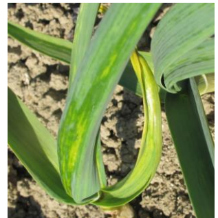
Symptôme d'acariens

Aceria tulipae est un acarien invisible à l'œil nu. Sa dissémination est assurée par les semences, par contact foliaire, par les insectes ou encore le vent. En culture, ces acariens peuvent être présents à l'aisselle des feuilles, puis ils migreront vers le bulbe à l'approche de la maturité, lorsque les conditions leur seront moins favorables. Les symptômes sur feuillage s'expriment sous forme de taches huileuses puis jaunes cireuses, principalement au niveau des plis. Après récolte, les attaques d'acariens peuvent être très préjudiciables (flétrissement du bulbe).