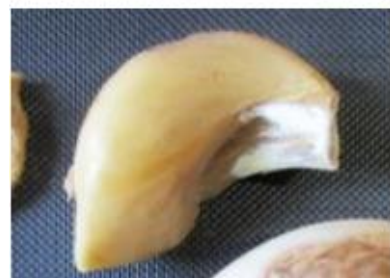
Acariens et fusariose : deux bio-agresseurs dont le développement au cours du stockage peut être réduit par le froid