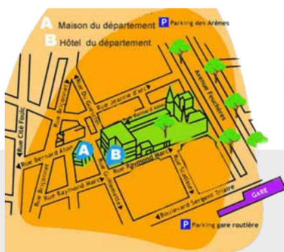
Plan d'accès à la Maison du Département (entrée A) et stationnement