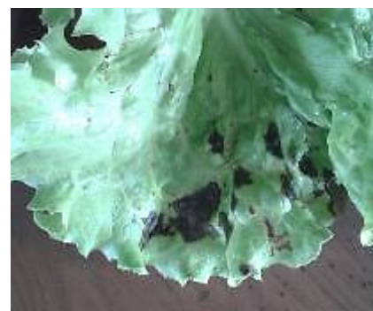
Symptômes de bactérioses

Conditions favorables à son développement : Pseudomonas cichorii se développe à des températures comprises entre 5 et 35°C, son optimum se situant aux alentours de 20-25°C. Elle affectionne particulièrement les ambiances humides. C'est pour cette raison qu'elle sévit essentiellement lors de périodes pluvieuses prolongées, durant lesquelles l'eau déposée sur les feuilles est favorable aux contaminations et à sa dissémination.