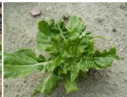
Palombe et dégâts

Sources des données sur les bioagresseurs : Ephytia (INRAE).