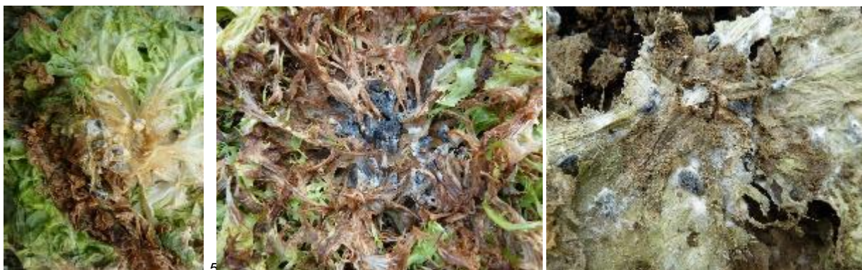
Symptômes de Sclérotinia – Photos CA31

Conditions favorables à son développement : Ces deux Sclerotinia sont capables de se développer à des températures comprises entre 4 et 30°C. Leurs optima thermiques se situent légèrement en-dessous de 20°C. Ils sont favorisés par les périodes humides et pluvieuses et affectionnent particulièrement les salades ayant atteint un stade de développement avancé.