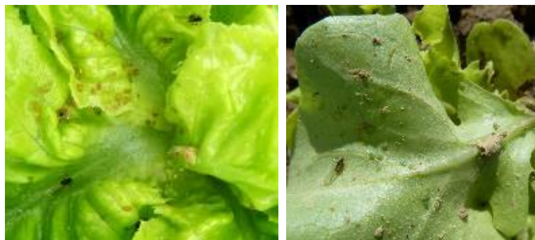
Pucerons (en haut : nasonovia ; en bas : puceron vert)

Diversifier l'environnement pour favoriser les auxiliaires.