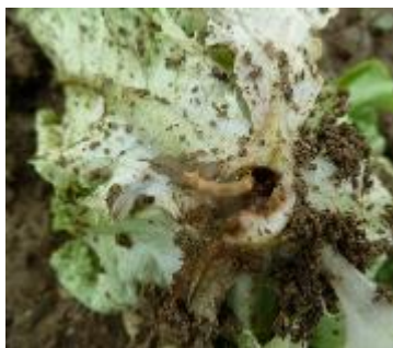
Taupins et dégâts