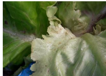
Dégâts de thrips

Difficile à observer, on repère leur présence grâce aux piqûres qu'ils occasionnent sur les premières couronnes. Lorsque ces dernières sont trop importantes, cela impacte la tenue en rayon des laitues. De fait, suivant le niveau d'attaque, les agréateurs peuvent refuser des lots.