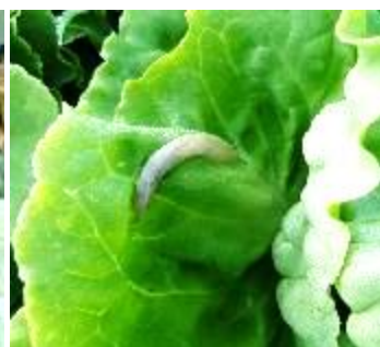
Limaces - Photos CA 31