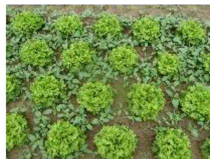
Début d'envahissement par le Datura Photo CA31

Dans tous les cas, le recours au désherbage mécanique est systématique.