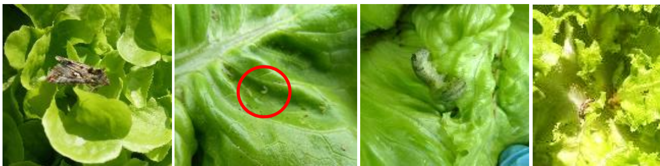
Chenilles phytophages : de gauche à droite : papillon d'A. gamma – jeune stade larvaire d'A gamma, chenille d'A gamma, jeunes chenilles d'H armigera

Prophylaxie : Les observations doivent être fréquentes et rigoureuses pour détecter les premiers individus aux premiers stades larvaires. On peut s'appuyer sur du piégeage pour suivre les vols.