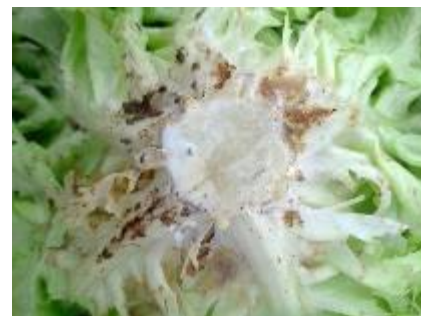
Rhizoctonia - Photos CA 31