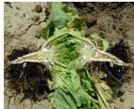
Symptômes de Pythium

Conditions favorables à son développement : Son développement est surtout favorisé par la présence d'eau. Une forte humidité du sol (90 % de la capacité de rétention) et des échanges gazeux réduits constituent un avantage écologique pour cet oomycète. La température influence moins sa croissance car des contaminations sont possibles entre 5 et 43°C. Il apprécie quand même les températures voisines de 20-24°C. Les jeunes plantes, les tissus succulents, sont plus sensibles.