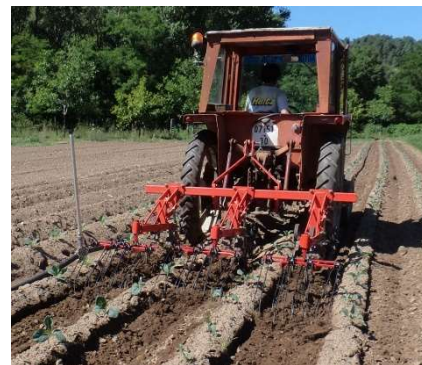
Binage mécanique - Photo CA30

Plus rarement, certains producteurs utilisent le paillage plastique , combiné à du goutte à goutte (producteurs en AB visant aussi une économie d'eau). C'est toutefois une pratique qui se développe dans d'autres régions (problématiques liées au vent et à la ressource en eau).