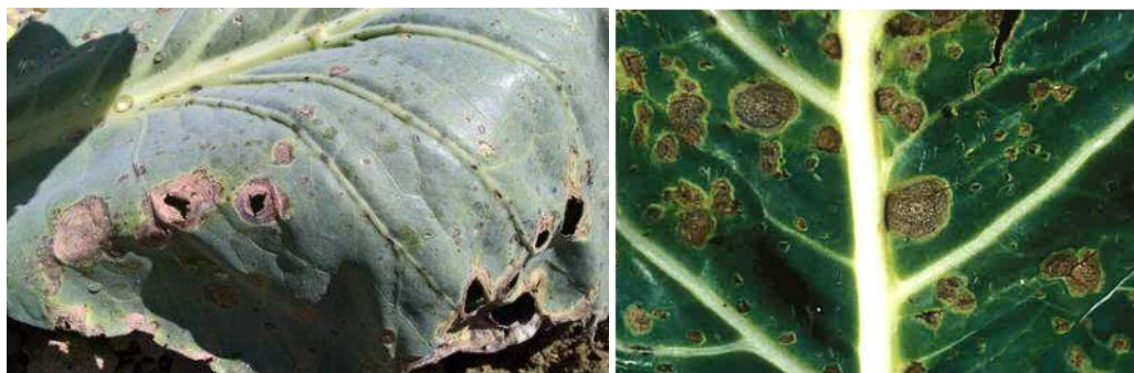
Taches d' Alternaria (à gauche) et de Mycosphaerella (à droite) sur chou