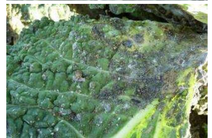
Aleurodes sur choux, développement de fumagine - Photo CA 31.

Techniques alternatives : Sous réserve de pouvoir atteindre le dessous des feuilles lors de l'application, il est possible de recourir à un produit de biocontrôle à base d'huile essentielle d'orange qui va réduire les populations (action de contact).