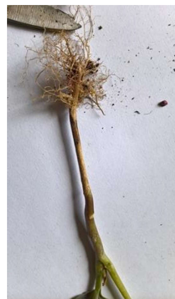
Nécrose du collet