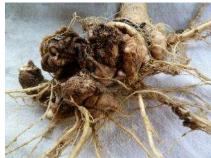
Hernie des crucifères

Le champignon se conserve longtemps (jusqu'à 10 ans sans crucifères dans la rotation). La maladie se développe entre 6 et 35°C avec un optimum thermique de 20-25°C, c'est donc une maladie essentiellement estivale.