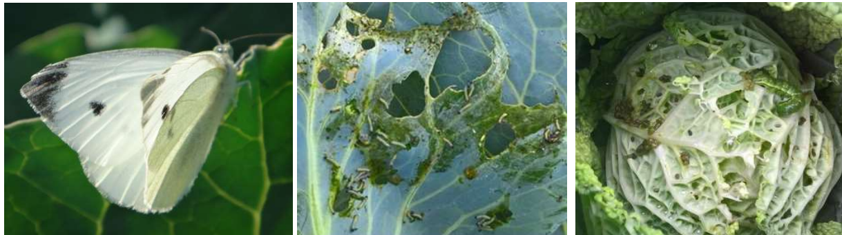
Chenilles phytophages : papillon et larves de piérides, noctuelle - Photos CA 30 et 31.