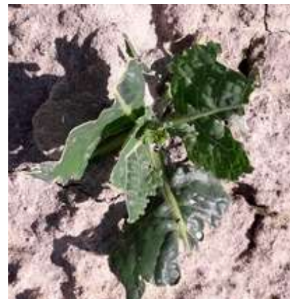
Dégâts d'oiseaux sur choux - Photo CA 31.