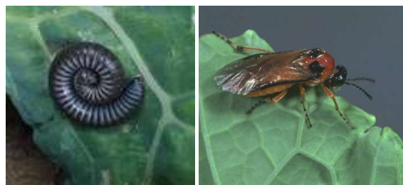
Tenthrede de la rave (larve et adulte)

⚠ Les Bt ne sont pas efficaces sur cette « fausse-chenille ».