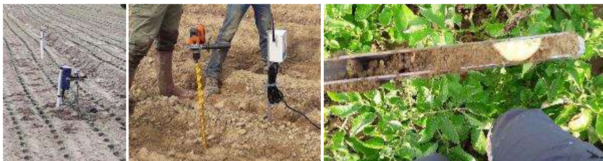
Sondes tensiométriques connectées, sonde capacitive connectée, humidité du sol sur 25 cm à l'aide d'une gouge