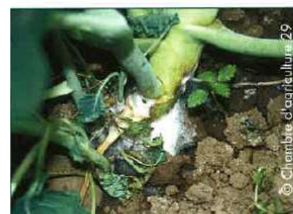
Sclérotinia sur collet de brocolis