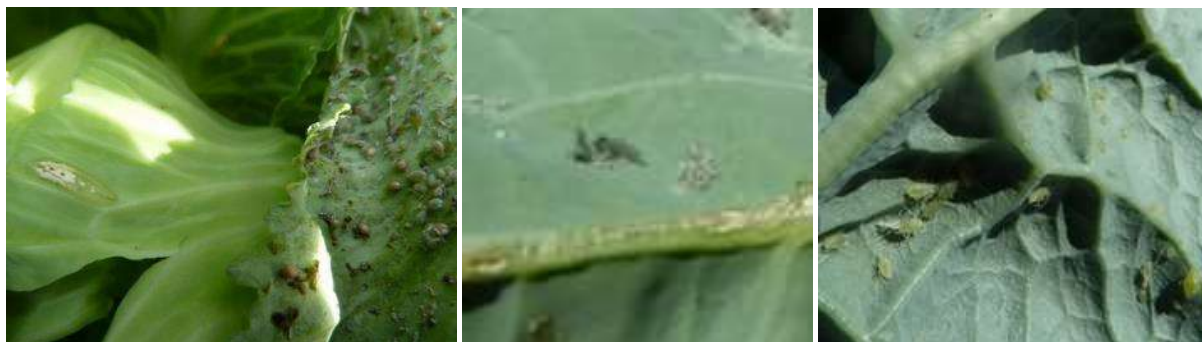
Pucerons et larve de syrphes, pucerons cendrés, pucerons verts - Photos CA 31.

En automne, apparaissent les individus sexués qui s'accoupleront. Les hivers doux permettent la survie des virginipares qui se multiplient dès février et dont la descendance ailée peut occasionner des pullulations précoces.