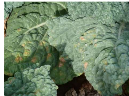
Taches de mildiou sèches