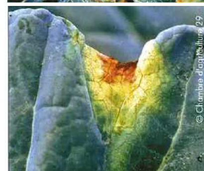
Bactériose bordure de feuille ou en « en V » Photos CA 29