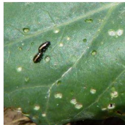
Altises sur chou