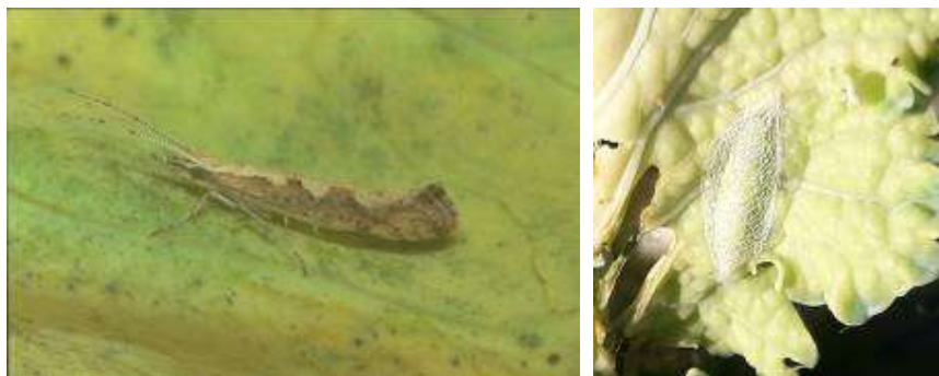
Teigne des crucifères : de gauche à droite : Adulte ; Chrysalide

Remarque : Ces dernières années, on n'a pas relevé, sur choux, de dégâts liés aux noctuelles terricoles : "vers gris" ( Agrotis segetum , A. ypsilon ...) qui, de fin juin à début août, peuvent couper au ras du sol les jeunes plants durant la nuit (la larve restant cachée dans le sol durant la journée).