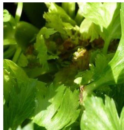
Cœur noir - Photo CA 31