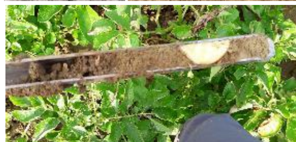
Sondes tensiométriques connectées, sonde capacitive connectée, humidité du sol sur 25 cm à l'aide d'une gouge