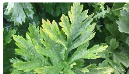
Carence Mg – Photo CA31