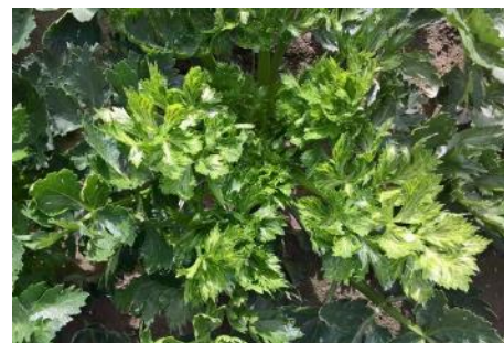
CeMV sur céleri - Photo CA 31

Dans ce mode de transmission, il n'y a pas de grande spécificité et un même virus peut être propagé par de nombreuses espèces de pucerons. Ainsi des pucerons non inféodés à une culture pourront jouer un rôle important dans la transmission virale par leurs simples piqûres d'essais.