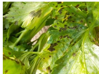
Taches de septoriose sur céleri

En raison de la couleur des feuilles atteintes, cette maladie est souvent appelée, à tort, « rouille du céleri ».