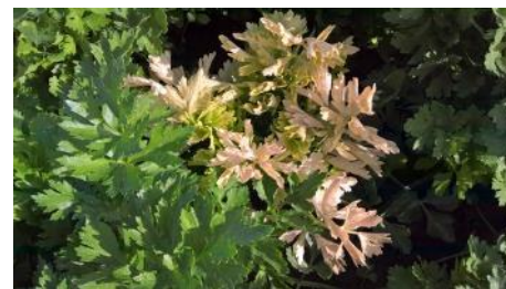
Aster Yellow - Photo CA 31

Ce phytoplasme est transmis de façon persistante, au cours de piqûres de nutrition, par plusieurs espèces de cicadelles, insectes piqueurs et suceurs de sève. Une fois en contact avec la feuille, elles piquent dans les vaisseaux du phloème pour se nourrir,