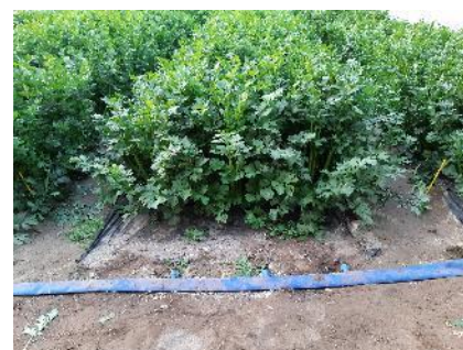
Céleri sur paillage et goutte à goutte

Des essais ont été conduits en station d'expérimentation avec du paillage plastique , combiné à du goutte à goutte avec des résultats intéressants.