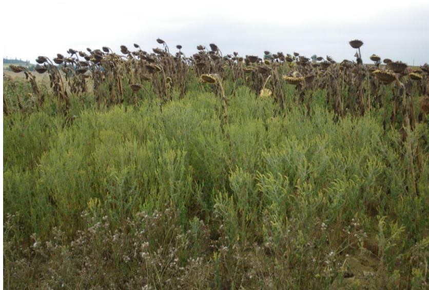
Infestation d'ambrosies dans une parcelle de tournesol à maturité