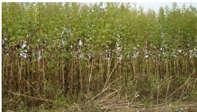
Infestation d'ambrosie trifide dans une parcelle de tournesol