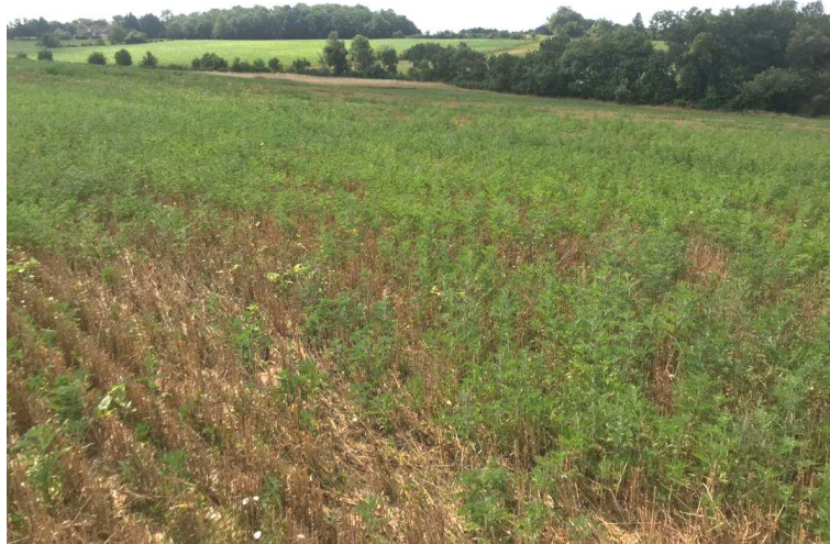
Infestation d'ambroisie dans des chaumes

Cette technique de déchaumage est efficace sur amброisie à feuilles d'armoise, amброisie trifide, xanthium (lampourde à gros fruits) et datura.