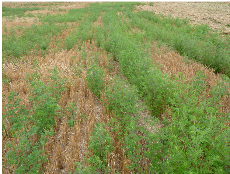
Ambroisie proche de la floraison

Attention au pollen allergène et à la grenaison qui pourrait entretenir l'infestation.