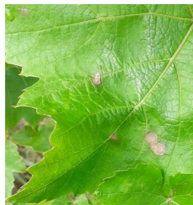
Tâches récentes de black-rot.

Surveillez le risque de pluie, des contaminations sont possibles. Restez très vigilants sur l'ensemble des parcelles.