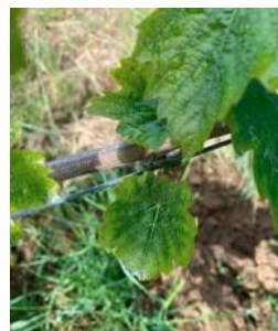
Carence en potasse

Présence de symptômes sur sol argilo-calcaire.