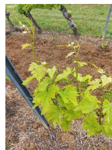
Chlorose ferrique _ photo CA81