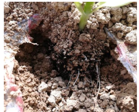
Enracinement d'un jeune plant

Le gel du 5 avril a engendré quelques pertes sur des parcelles. Les fréquences sont faibles.