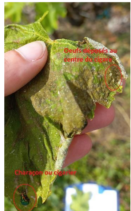
Cigarier et œufs déposés au centre du cigare