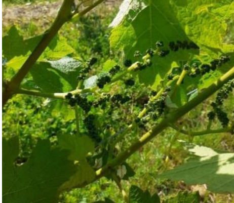
Stade 17 : boutons floraux séparés

Photo CA82 – stades selon échelle Eichhorn et Lorenz