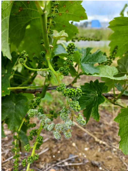
Mildiou sur grappe – 22 mai 23

Elles sont généralement sporulées. Quelques grappes sont aussi impactées de manière sporadique, notamment sur Merlot, Mauzac, Gamay et Loin de l'œil.