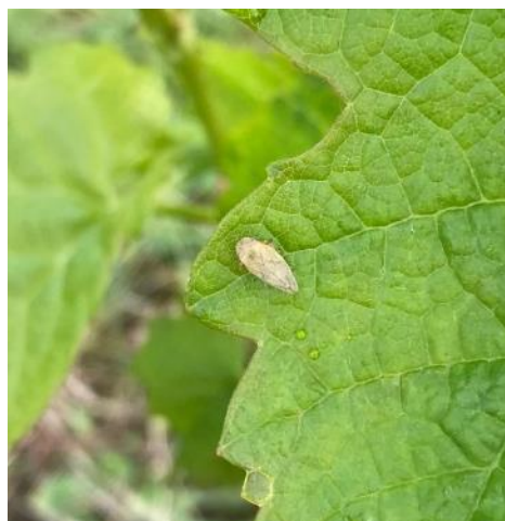
Cicadelle écumeuse

Compte-tenu des conditions météorologiques, la gestion de l'herbe est difficile et on relève une présence problématique de folle avoine dans de nombreuses parcelles.