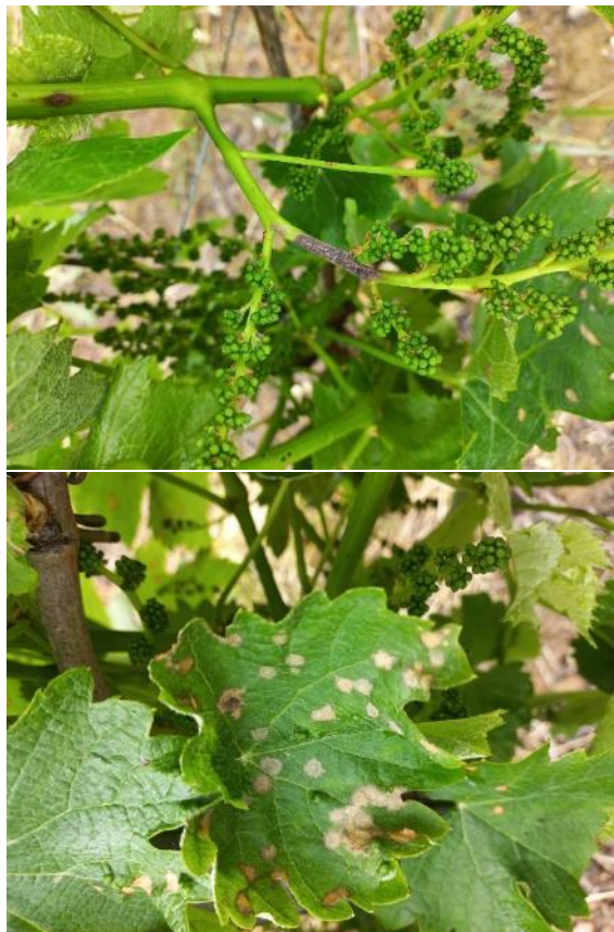
Symptômes de black-rot observés le 22 mai 2023 - Photos CA81