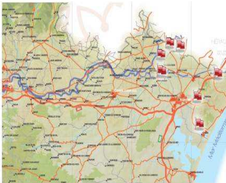
Carte du réseau fermes Ecophyto Narbonnais