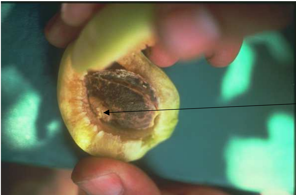
Décoloration de la chair et taches chlorotiques (claires) sur le noyau d' abricot