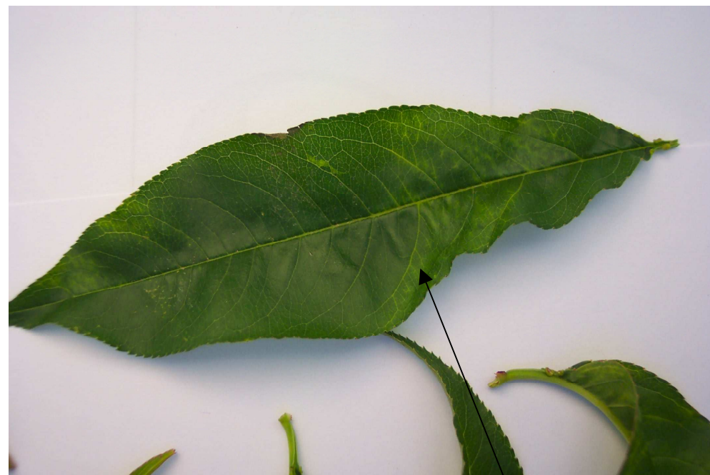
Décoloration autour des nervures, d'aspect translucide, sur feuilles de pêcher