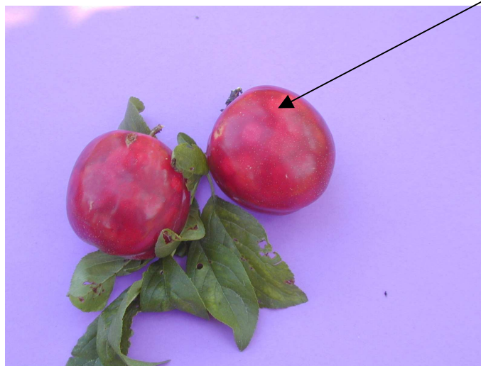
Taches de décoloration chlorotiques sur fruits de prunes... et de pêches , avec déformation (bosselage)

Poste de Montpellier : Place Chaptal – CS 70039 34060 MONTPELLIER CEDEX 02 Tel : 04 67 10 19 50 – Fax : 04 67 10 19 46