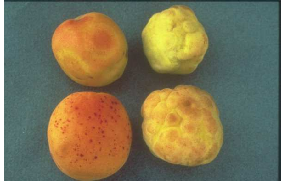
Anneaux jaunâtres et déformations sur fruits d' abricot