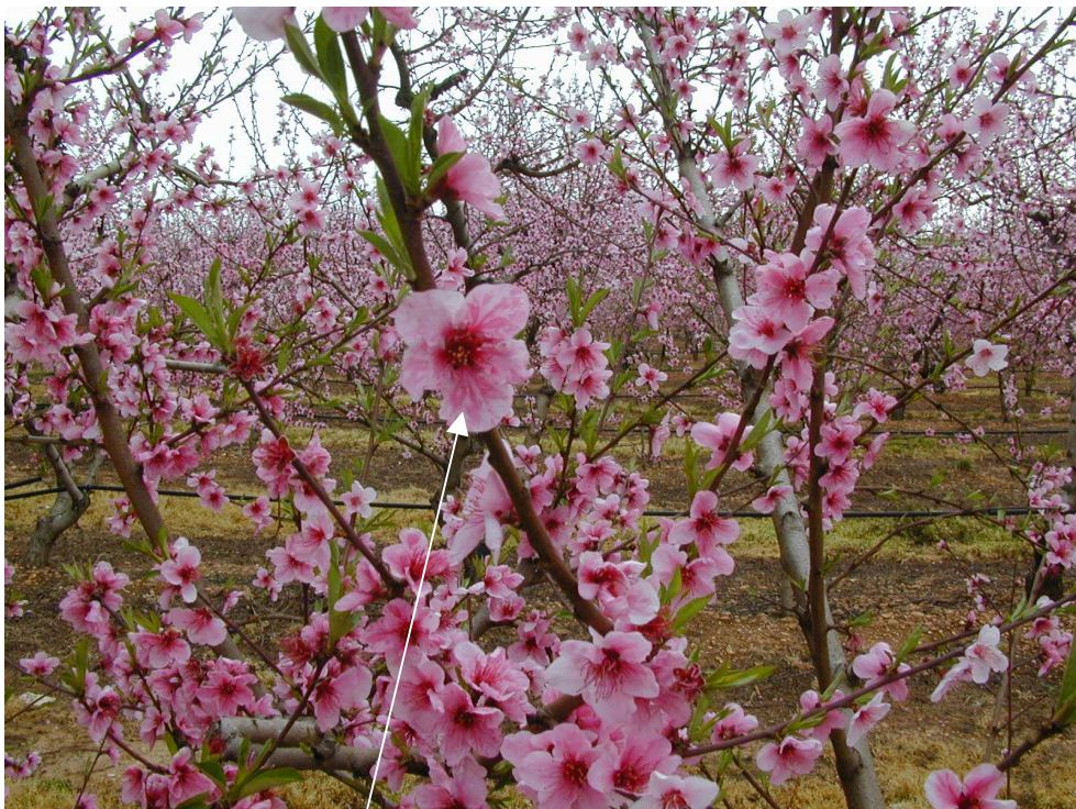
Stries plus foncées sur fleurs de pêchers , variétés rosacées