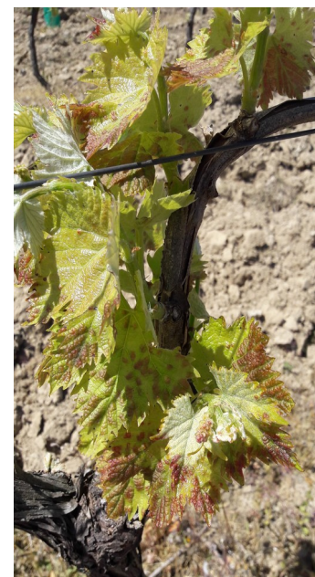
Erinose : symptômes précoces

L'utilisation de moyens de bio-contrôle à base de soufre mouillable est possible et efficace.