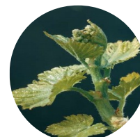
Stade 12 : Inflorescences visibles

Stade 9 : 2-3 feuilles étalées Stade 10 : 3-4 feuilles étalées Stade 11 : 4-5 feuilles étalées Stade 12 : 5-6 feuilles étalées-grappes visibles Stade 13 : 6-7 feuilles étalées Stade 15 : boutons floraux agglomérés Stade 17 : boutons floraux séparés