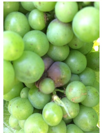
Botrytis sur grappe