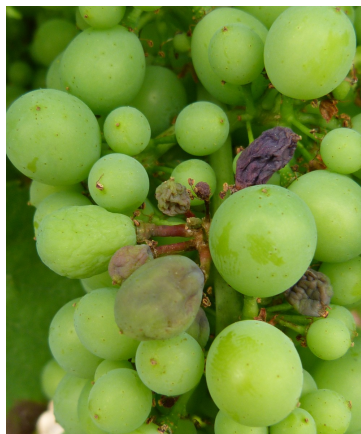
Mildiou sur grappe facière "rot brun"