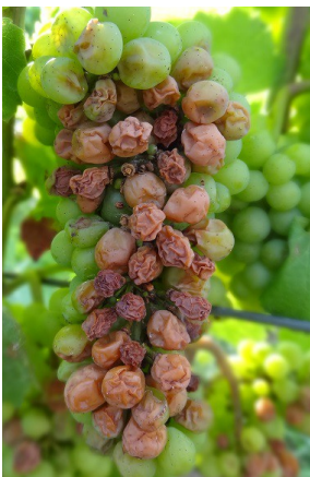
Dégâts d'échaudage sur grappes

Pour le Botrytis , à ce stade, le plus souvent ce sont les baies à l'intérieur des grappes qui montrent les premiers symptômes (cas les plus fréquents : éclatement de grains dans les grappes pignées, baies blessées par des impacts de grêle ...).