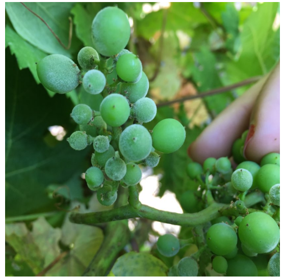
Oïdium : feutrage blanc sur grappe

Mesures prophylactique : Favoriser l'insolation et l'aération des grappes car l'oïdium est sensible aux UV (Ex : effeuillage)