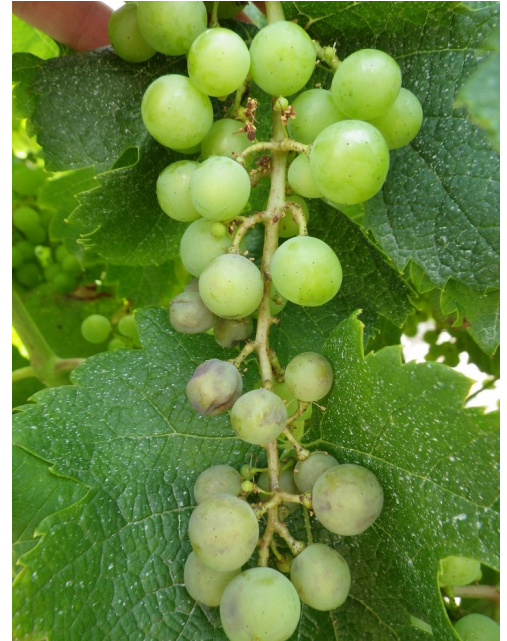
Rot brun sur grappe

Les calculs du modèle sont basés sur une série de « points » qui permettent de donner une tendance de l'évolution de la pression mais qui ne rendent pas compte de toute l'hétérogénéité des niveaux de pluies enregistrés sur l'ensemble du vignoble. Les informations ci-dessous pourraient donc occulter des situations particulières qui ne seraient pas représentées par les tendances générales par secteurs.