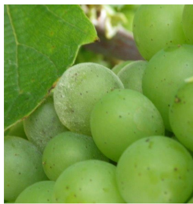
Oïdium : les grains sont d'abord recouverts d'une poussière grise d'aspect cendré.