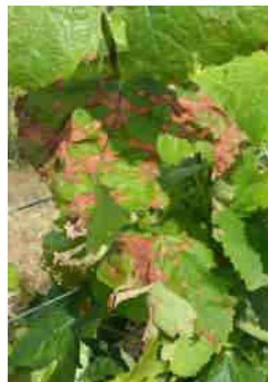
Dégâts de black-rot sur témoin non traité_11 juin 2018_CA81

Soyez donc vigilants au risque de nouvelles contaminations et de repiquages sur parcelles atteintes.