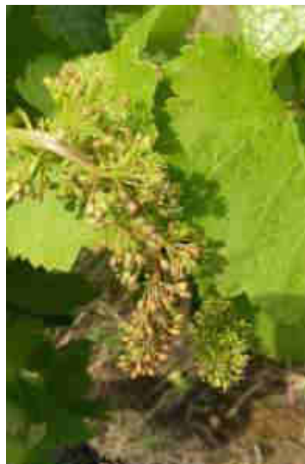
Mildiou sur grappe_8 juin 2018_CA81

Mesures prophylactiques : l'épamprage permet de diminuer le développement d'organes vert à proximité du sol qui seraient autant de support pour des contaminations primaires.