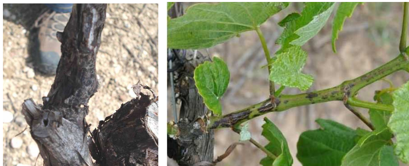
Excoriose : Symptômes sur bois et rameaux à gauche : Chancres d'excoriose sur bois d'un an à droite : Lésion sur jeune rameau

Les symptômes d'excoriose sur bois d'un an sont rares. Les conditions de l'année passée n'avaient pas été favorables aux contaminations.