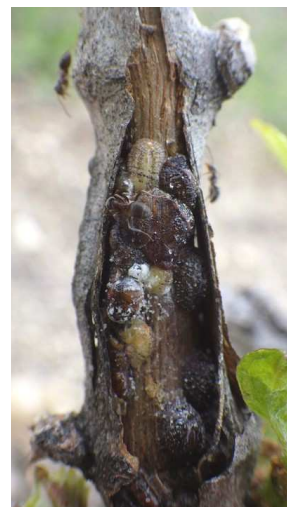
Cochenilles lécanines sur rameau de vigne

Les cochenilles se nourrissent de la sève en piquant les tissus végétaux. Ces prélèvements répétés peuvent affaiblir le cep, en cas de population importante. Par ailleurs, les cochenilles sont vectrices du virus de l'enroulement.