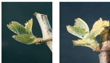
Rappel des stades de sensibilité de la vigne aux contaminations par l'excoriose = stade 6 (sortie des feuilles) à stade 9 (premières feuilles étalées)

La période de sensibilité de la vigne s'étend du stade 6 (éclatement des bourgeons/sortie des feuilles) au stade 9 (premières feuilles étalées). La croissance végétative met ensuite la partie terminale sensible du sarment hors de portée des contaminations par le champignon.