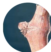
Stade 1 : Bourgeon d'hiver

A titre indicatif, les calculs de sommes de températures effectués sur un des postes météo du réseau de surveillance nous indique que la campagne 2018 se situerait, à ce jour, plutôt dans la « moyenne » des précédentes campagnes. Malgré un mois de janvier doux qui aurait pu faire pencher la balance vers un début de saison précoce, les vagues de froid qui ont suivi place ce début de saison dans la norme.