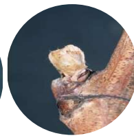
Stade 3 : Bourgeon dans le coton