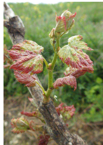
Erinose : dégâts précoce sur Muscadelle

Les femelles hivernent dans les écailles des bourgeons et colonisent très tôt les jeunes feuilles pour se nourrir et pondre. Très rapidement après le débourrement démarre une phase de reproduction de l'acarien au cours de laquelle seront produites les populations d'adultes des premières générations estivales qui vont migrer vers le bourgeon terminal et les nouvelles feuilles des rameaux. Cette migration démarre fin mai et s'intensifie après la floraison.