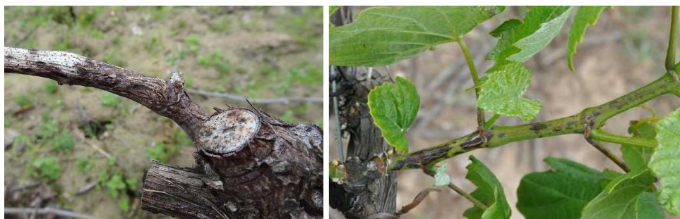
Excoriose : Symptômes sur bois et rameaux à gauche : Chancre d'excoriose sur bois d'un an à droite : Lésion sur jeune rameau

Les attaques apparaissent au printemps, sur les jeunes rameaux, peu après le débournement, et se manifestent par des taches brun-noir parfois d'aspect liégeux à la hauteur des premiers entre-nœuds.