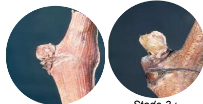
Stade 1 : Bourgeon d'hiver

Les températures froides de cette semaine ne seront pas favorables à une progression rapide de la phénologie.