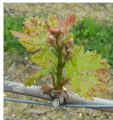
Erinose : dégâts précoce sur jeunes feuilles

Les femelles hivernent dans les écailles des bourgeons et colonisent très tôt les jeunes feuilles pour se nourrir et pondre. Très rapidement après le débourrement démarre une phase de reproduction de l'acarien au cours de laquelle seront produites les populations d'adultes des premières générations estivales qui vont migrer vers le bourgeon terminal et les nouvelles feuilles des rameaux. Cette migration démarre fin mai et s'intensifie après la floraison.